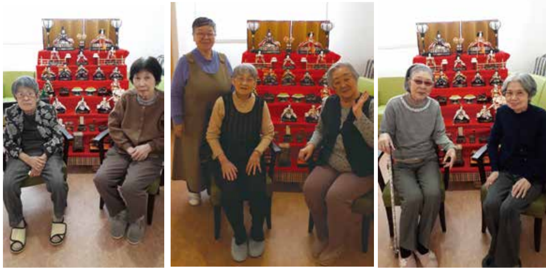
お雛様の前で記念撮影♪パチリ 皆様素敵な笑顔でした