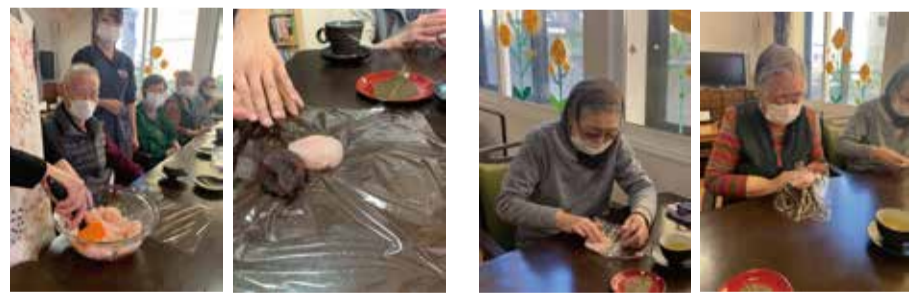
蒸らし終わった生地を人数分に分けます。