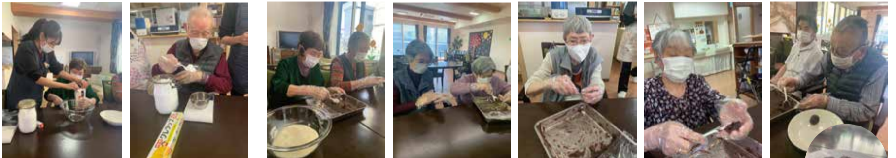
道明寺粉・お砂糖・水を混ぜて生地を作ります。