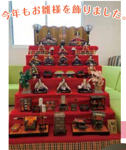
今年もお雛様を飾りました。