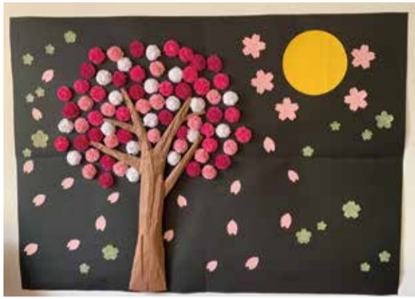
食堂に大きく飾られた桜の木。北海道も桜の季節になりましたね。すこやか苑宮の沢の桜も綺麗に咲き誇り