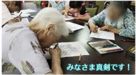
みなさま真剣です！