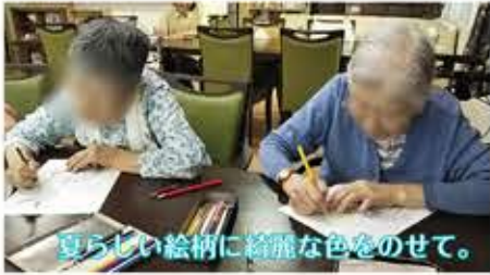
夏らしい絵柄に綺麗な色をのせて。