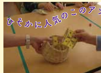
紹介していいのかな？ いけない大人の…シリーズ。 ひそかに人気のこのアンビ

5月に入り、桜も満開！新しい時代も無事に幕を開け「令和」も生サービスセンターすこやかは元気いっぱいです！あたたかい日も続き、5月なのに 30℃を超える日もありました。熱中症対策をしっかりとしながら、初夏を存分に楽しんでいきたいと思います。今月もたくさんの活動を通じてみなさまの笑顔をとくさん見ることができました。