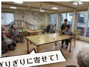
ぎりぎりに寄せて！

テーブルから落とさず端に狙いを定め、ぎりぎりに寄せて止めます。ちょっとした力加減に皆様四苦八苦しながらも大笑い！