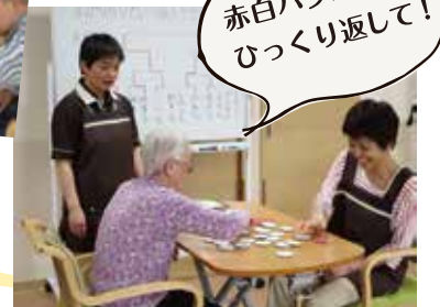
赤白パタパタひっくり返して！