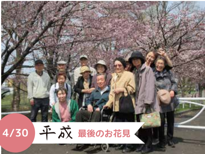
4/30 平成 最後のお花見

晴天の日。窓の掃除を行いました。入居者様にもお手伝いいただきました！冬を乗り越り、ほこりっぽくなった窓をさっぱりとお掃除。ピカピカで気持ちよくなりました♪