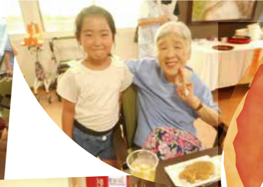
デイサービスのみなさま！

今回は音楽療法に注目！音楽に合わせて歌をうたい、楽器を使って波の音を出したり、布を使って波を表現したりしました。