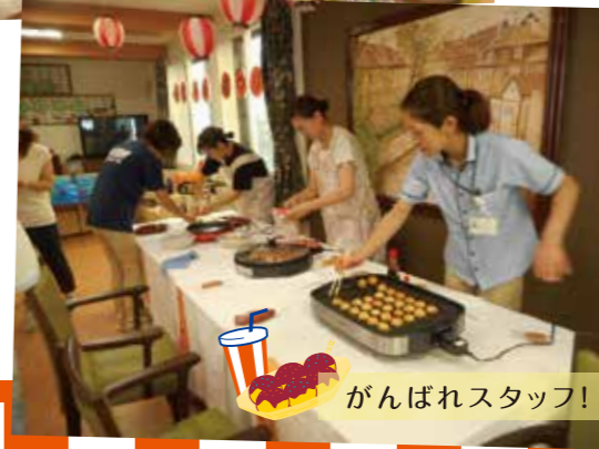
がんばれスタッフ！

すこやか夏祭りを開催しました！ デイサービスのみなさまにも来ていただき、みんなでわいわい賑やかなお祭りとなりました。