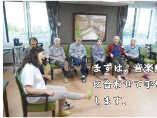
まずは、音楽療法。音楽に合わせて手や足を動かします。