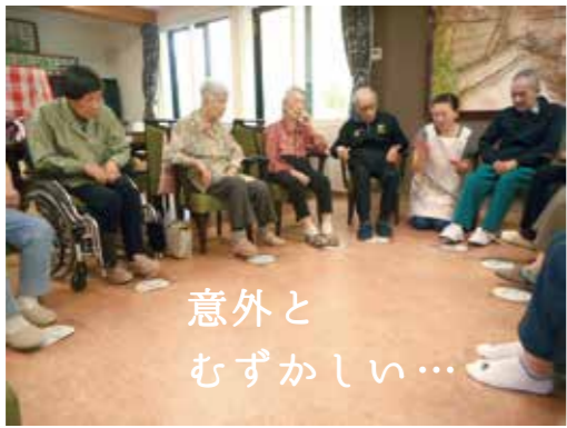
意外とむずかしい…

「あんたがたどこさ」の足パージョン！足踏みでリズムをとりながら「さ」で足元の「さ」マークを踏みます。