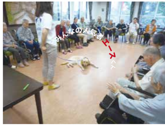
みんなの人気者エースくん