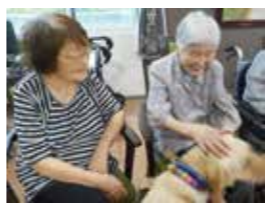
「エースくん、いい子だよ〜」