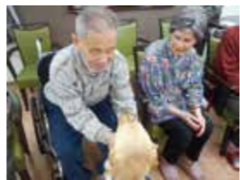
そして、待ちに待ったエースくんとのふれあい！