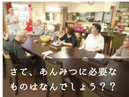
さて、あんみつに必要なものはなんでしょう？