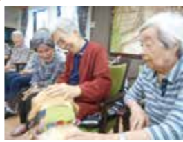
「よしよしよし」と自然と笑顔になりますね。