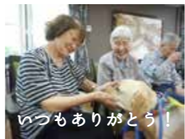
いつもありがとう！