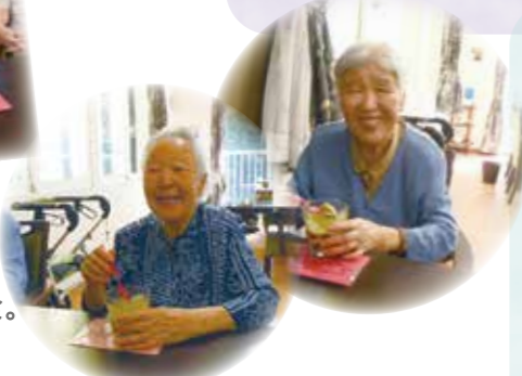
「美味しい♪」の笑顔いただきました！